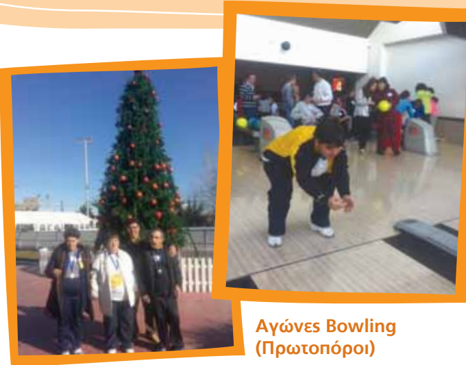
Αγώνες Bowling (Πρωτοπόροι)

Αξιολογώντας τις δυνατότητες των ενοίκων και λαμβάνοντας υπόψη τις προτιμήσεις και τα ενδιαφέροντά τους, διαφορετικοί κάθε φορά αθλητές συμμετείχαν στους παρακάτω αγώνες: