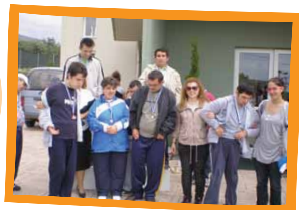
Ημερίδα αθλητικών δραστηριοτήτων (Αγ. Νικόλαος)